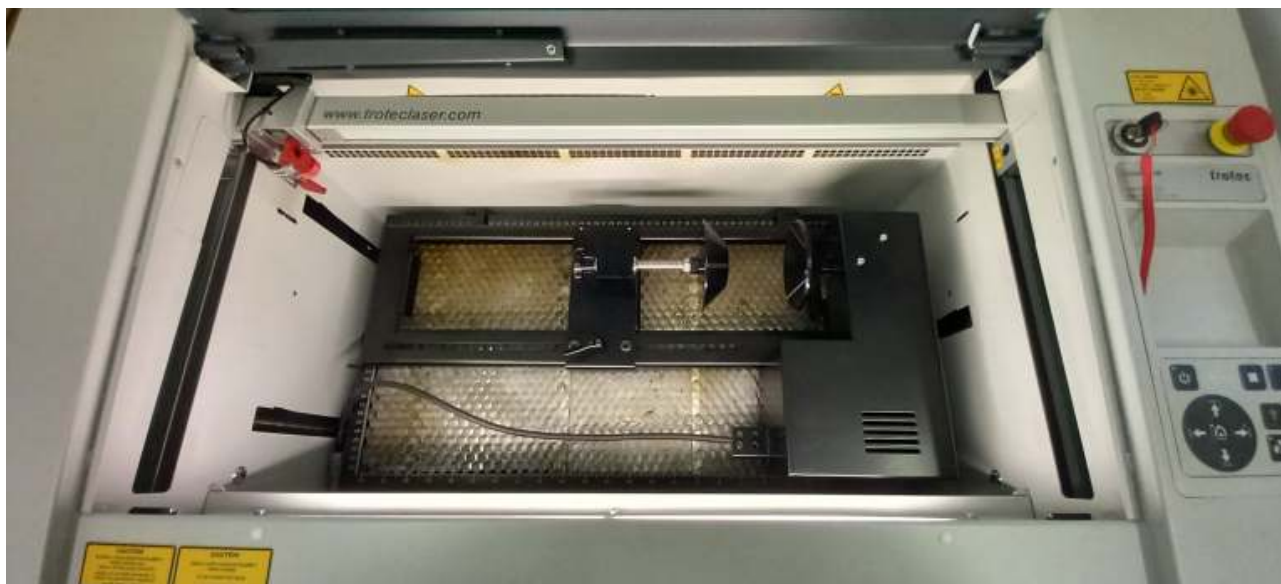
Foto dell'apparato collaudato